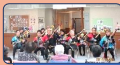
ボランティアグループ絆様