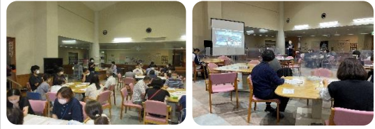
虐待防止研修 ハラスメント防止研修

高齢者虐待の事例検討やハラスメントの現状などについて話し合い、マニュアルの見直し等を行いました。また、今年度は2度社内研修を実施しています。