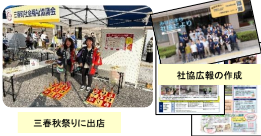
三春秋祭りに出店