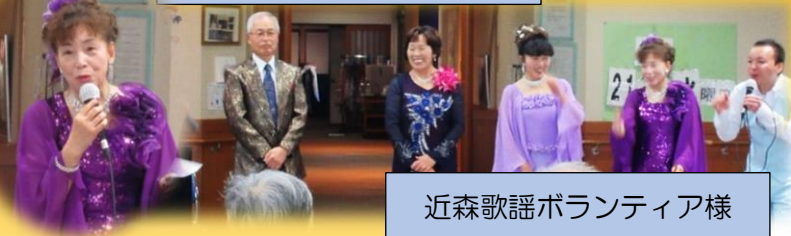
近森歌謡ボランティア様

ボランティア参加したい方、ボランティア派遣を希望される施設の方も、お気軽にお問い合わせください。お待ちしております(^.^*)/^^