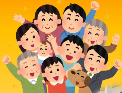
ボランティアグループ絆様