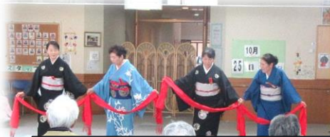
三春町舞踊団体連絡協議会様