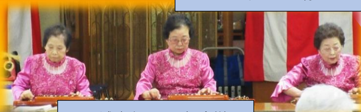
琴城流大正琴千智会様