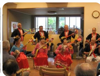
★むつみ会やってみっかい様 は～とらいふ三春