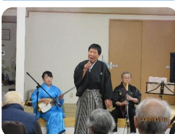
★かつらお民謡会様 グループホームほほえみ