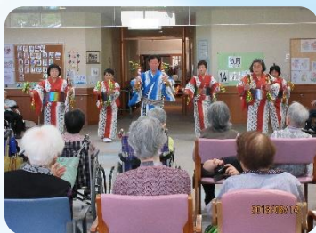
★三春町舞踊団体連絡協議会様 三春町通所介護事業所

この春～夏も誕生会や夏祭りなどで、たくさんの団体の皆様にご協力いただきました。ボランティアの様子をぜひご覧ください！