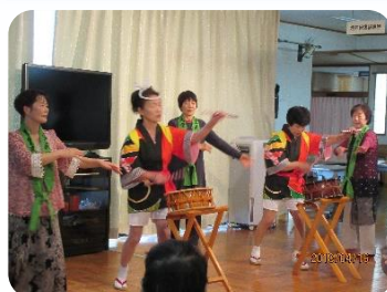
★歌姫会様 特養あぶくま荘