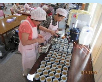
★三春町赤十字奉仕団様 三春町通所介護事業所