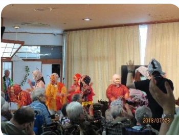
★富岡ひよっこ連様 特養あぶくま荘