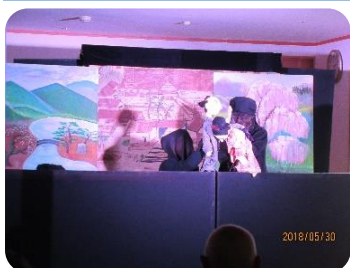
★元気なかつらおプロジェクト様 グループホームほほえみ