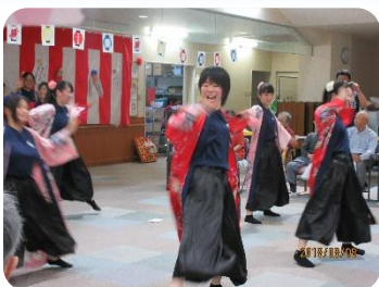
★田村高校 JRC イター-アト部様 三春町通所介護事業所