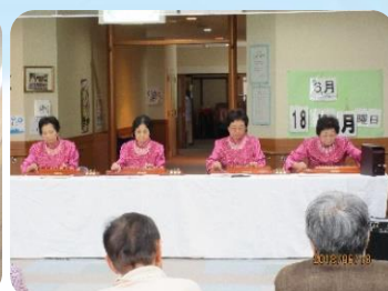
★琴城流大正琴様 三春町通所介護事業所